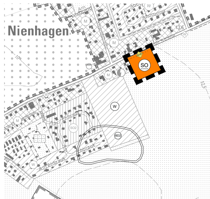
6. Änderung des Flächennutzungsplanes Sondergebiet Einzelhandel